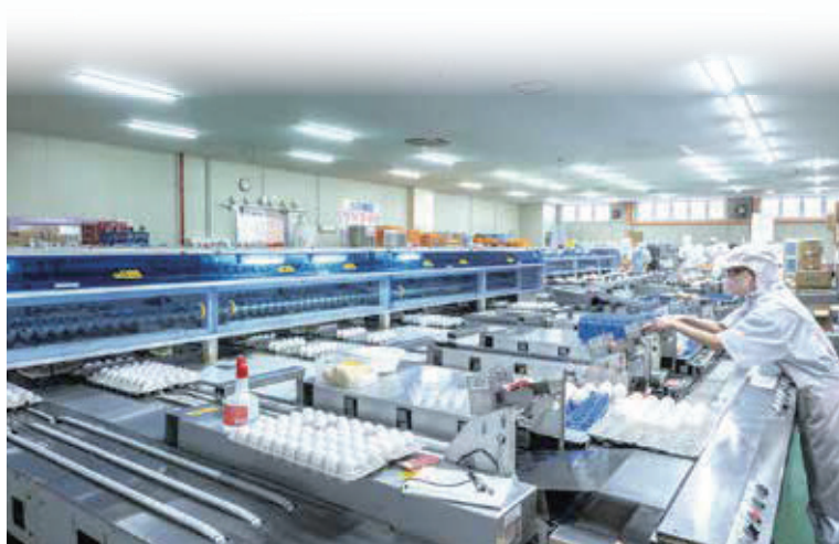
パッキング工場ライン