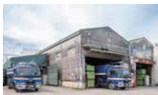
■ 飼料配送センター