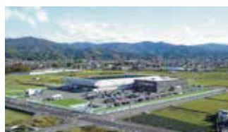
■ 本社 総務部・管理部・品質管理室・営業部（第一・第二・第三・第四・第六営業）