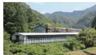
■ 広島ブロイラー（養鶏）