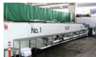
■ 東京事業所（足立市場内生簀）