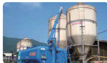
飼料運搬車にてタンクへ給餌