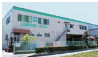
■ ブロイラー事業部