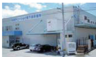
■ 本社（総務部・管理部・水産事業部）

畜産・水産物を原料とし、半製品（唐揚げ・とんかつ等）・串製品などを自社加工しています。国産志向が高まる中、国産原料の焼鳥などが好評です。冷凍食品、水産加工品も販売しています。