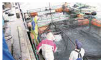
■ 鹿児島出張所（取引先での水揚げ様子）