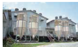
■ 宇和ファーム（採卵養鶏場）