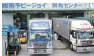
■ 鮮魚センター（坂下津事業所）