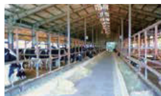
■ 西予営業所（牛肥育農場）