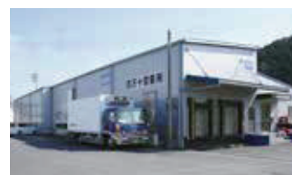
■ 四万十営業所 兼 豚肉解体工場