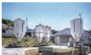
■ 菊間ファーム（採卵養鶏場）